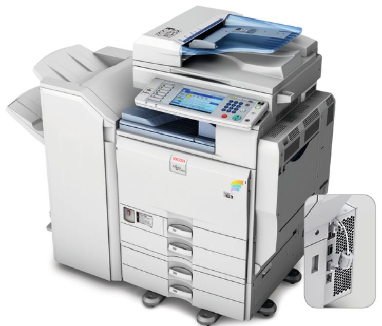
Color Controller E-3200/E-5200