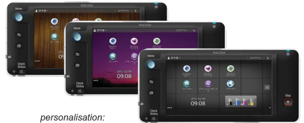
personalisation: adjustable wallpapers